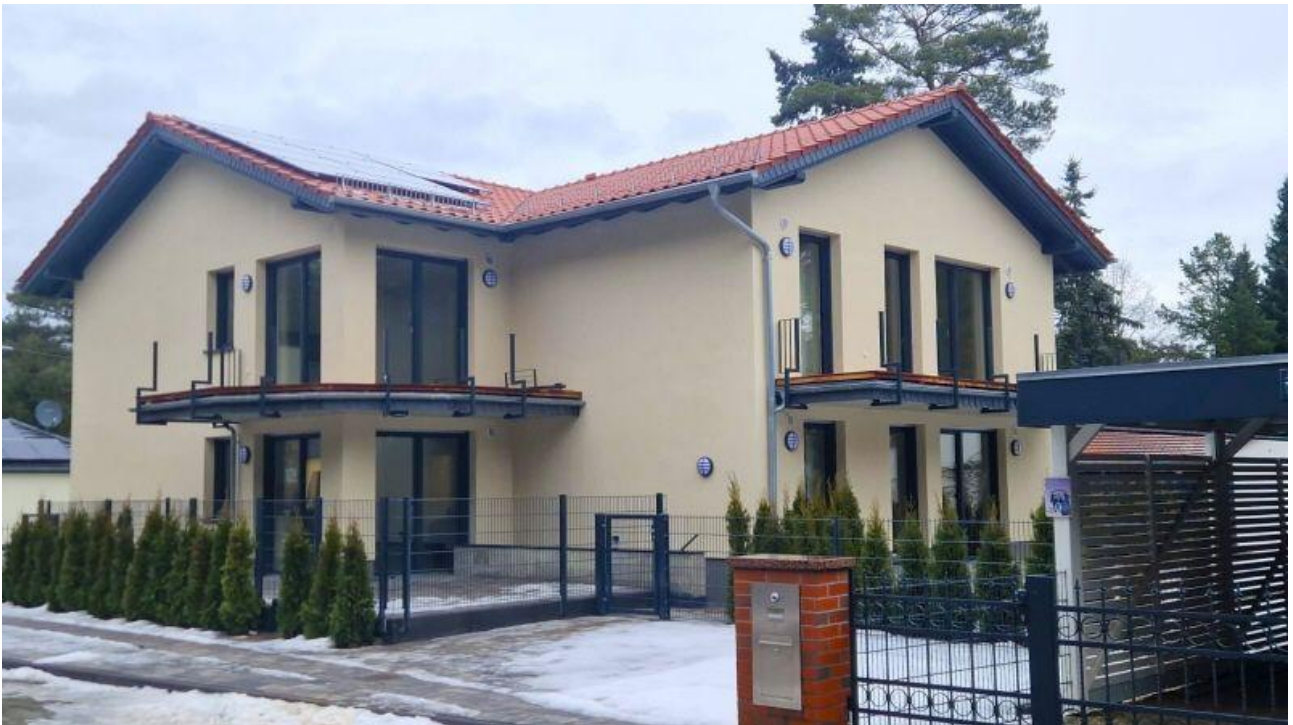
Hausansicht in Bauphase